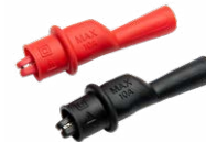
Krokodilklemme Mini, 1 kV 10 A (Set) WAKROKPL10MINI