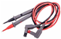
Prüfkabel für CMM (CAT IV, M) WAPRCMM2