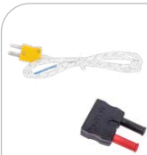
Temperaturmessung Sonde Typ K WASONTEMK Adapter WAADATEMK