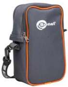
Tragtasche M13 WAFUTM13