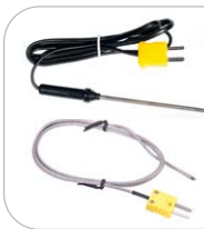
Temperaturmessung Sonde (Typ K, Bajonett) WASONTEMP Sonde (Typ K, Metall) WASONTEMK2