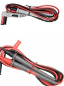
Satz Messleitungen für CMM CMM/CMP WAPRCMP1 CAT IV, S WAPRCMM1